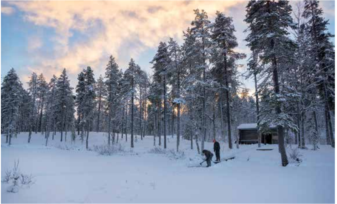
Maisemia Kenttälammen kämpän ympäristöstä Naruskalla.